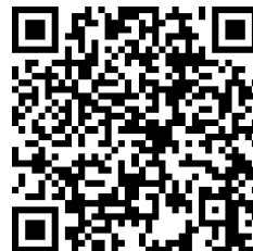
当社応募フォーム

https://job.mynavi.jp/25/pc/search/corp96058/outline.html